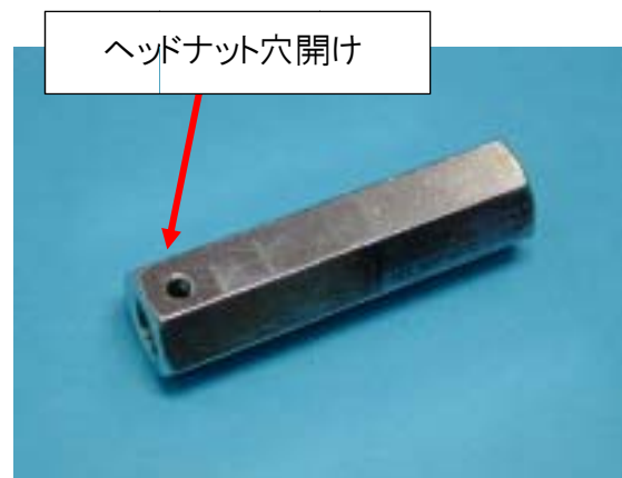
ヘッドナット穴開け