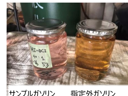
サンプルガソリン 指定外ガソリン