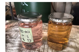
サンプルガソリン 指定外ガソリン