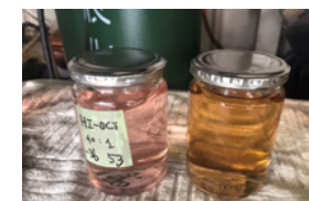
サンプルガソリン 指定外ガソリン