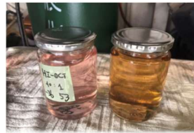
サンプルガソリン 指定外ガソリン