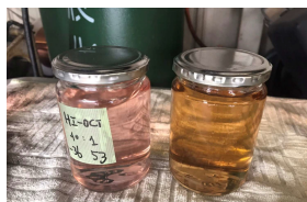
サンプルガソリン 指定外ガソリン